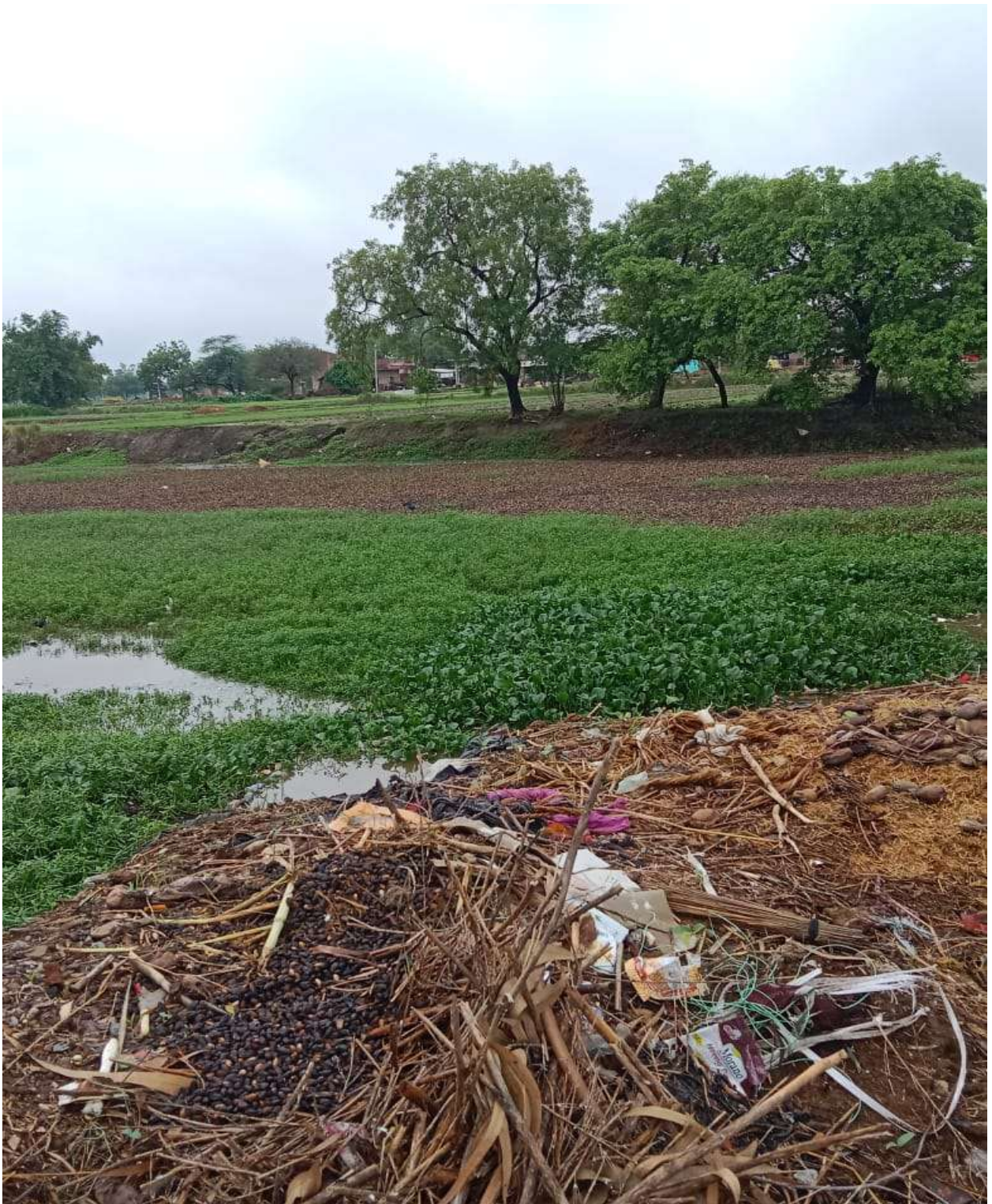
SAVALPUR VILLAGE JHEELHAK BLOCK PHOTO