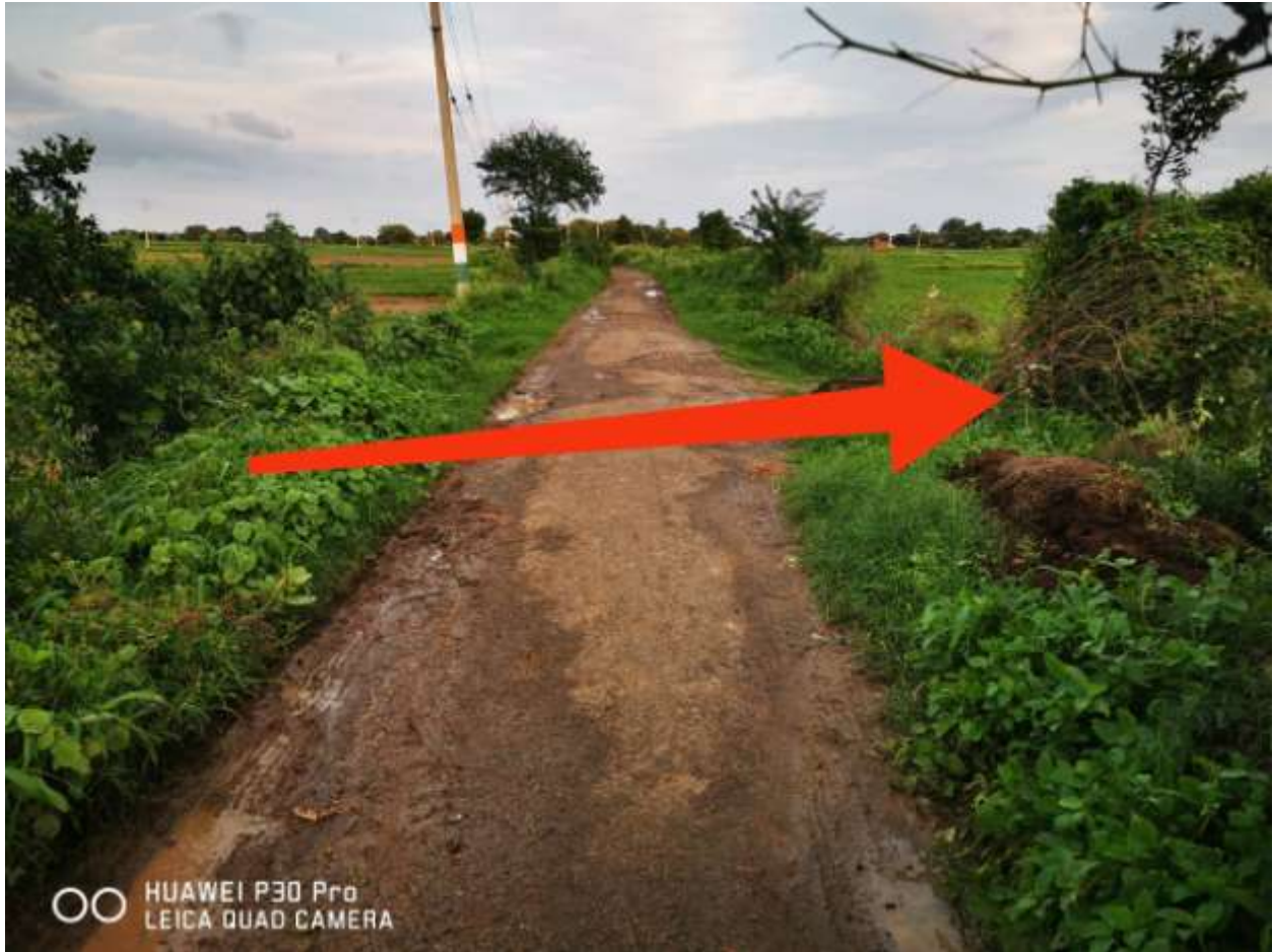
THIS CULVERT made by PWD Kanpur Dehat in Vichhavli bangar at the when road's Constraction