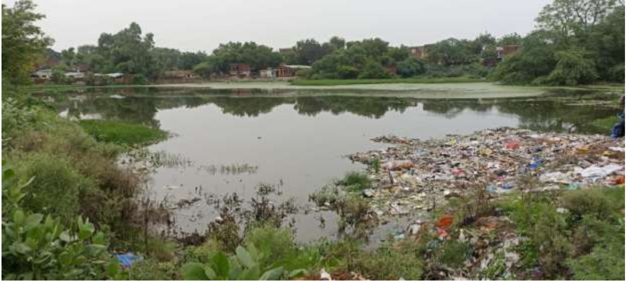
SIKANDRA KANPUR DEHAT PHOTO GRAPH