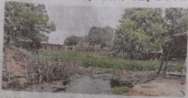
कब्जे में सिमटा पिलासपुर बागर गांव का तालाब • सौ. कबीरा

जल संरक्षण को बढ़ावा देने के लिए शासन की ओर से तालाबों को संरक्षित कर अमृत सरोवर का रूप दिया जा रहा है। तालाबों के सुंदरीकरण के लिए सरकार करोड़ों रुपये खर्च कर रही है। धरातल में अधिकांश तालाब कब्जे का शिकार हैं। वर्ष 1952 के अभिलेखों के अनुसार जिले में 6500 से अधिक तालाब, झील, पोखर स्थित हैं, लेकिन मौजूद समय में कब्जे के